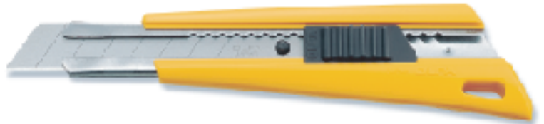
FL ▲大型刀 替刃式