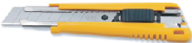
EXL ▲大型刀 替刃式