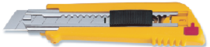
PL-1 ▲專業用六連發 替刃式