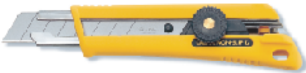
NOL-1 ▲抗滑握把 替刃式