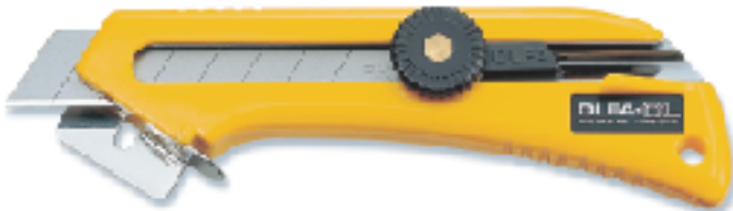
CL ▲大型刀 替刃式