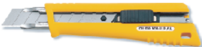
NL-AL ▲抗滑握把 替刃式