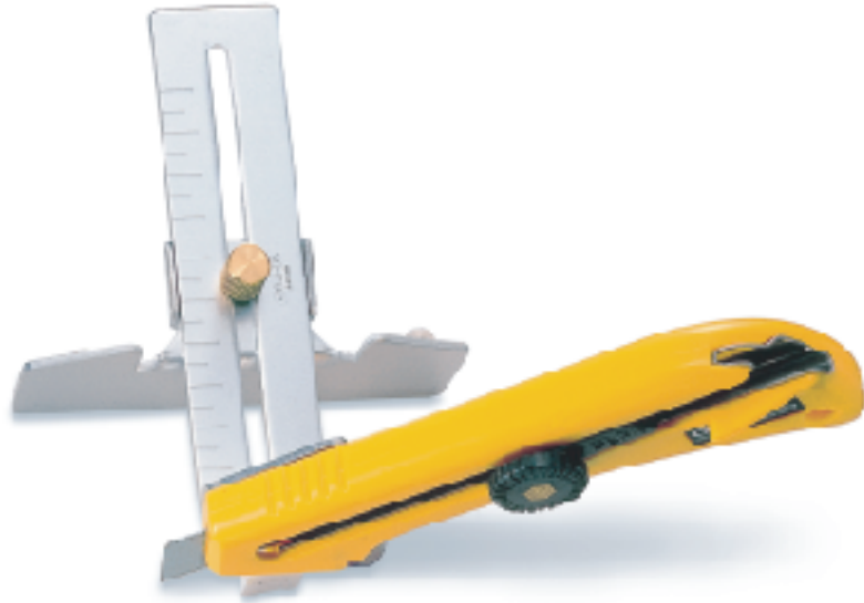
KL ▲大型刀 替刃式