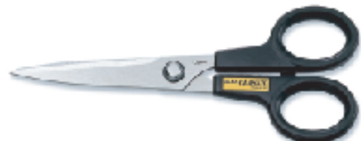
CC-SCS ▲剪刀 替刃式