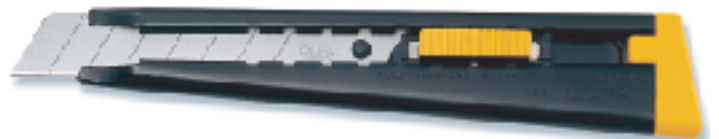
ML ▲大型刀 替刃式