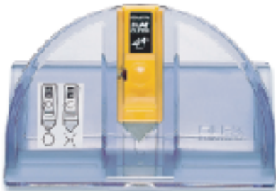
MC-45 ▲45度角斜口刀 替刃式