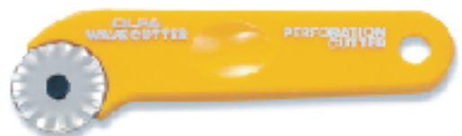
WAC-1 ▲波浪刀 替刃式