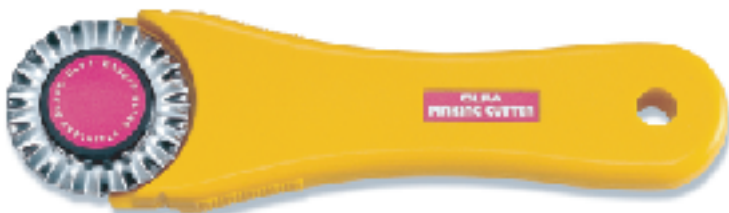
PIK-2 ▲鋸齒刀 替刃式