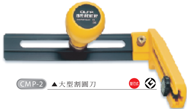
CMP-2 ▲大型割圓刀 替刃式