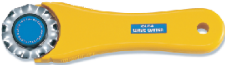
WAC-2 ▲波浪刀 替刃式