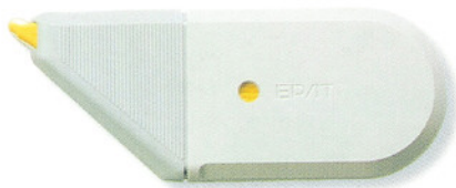
EPAT ▲修正帶 5mm×10M