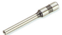
▲電動穿孔機針 VS-25型使用