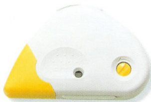
Mini ▲修正帶 5mm×7M