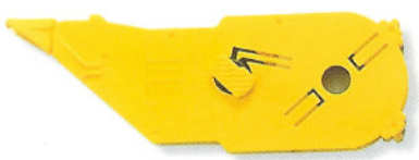
EPAT ▲修正帶替換帶 5mm×10M