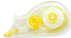
CLEAR ▲拋棄式修正帶 4.2mm×6M