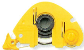
Mini ▲修正帶替換帶 5mm×7M